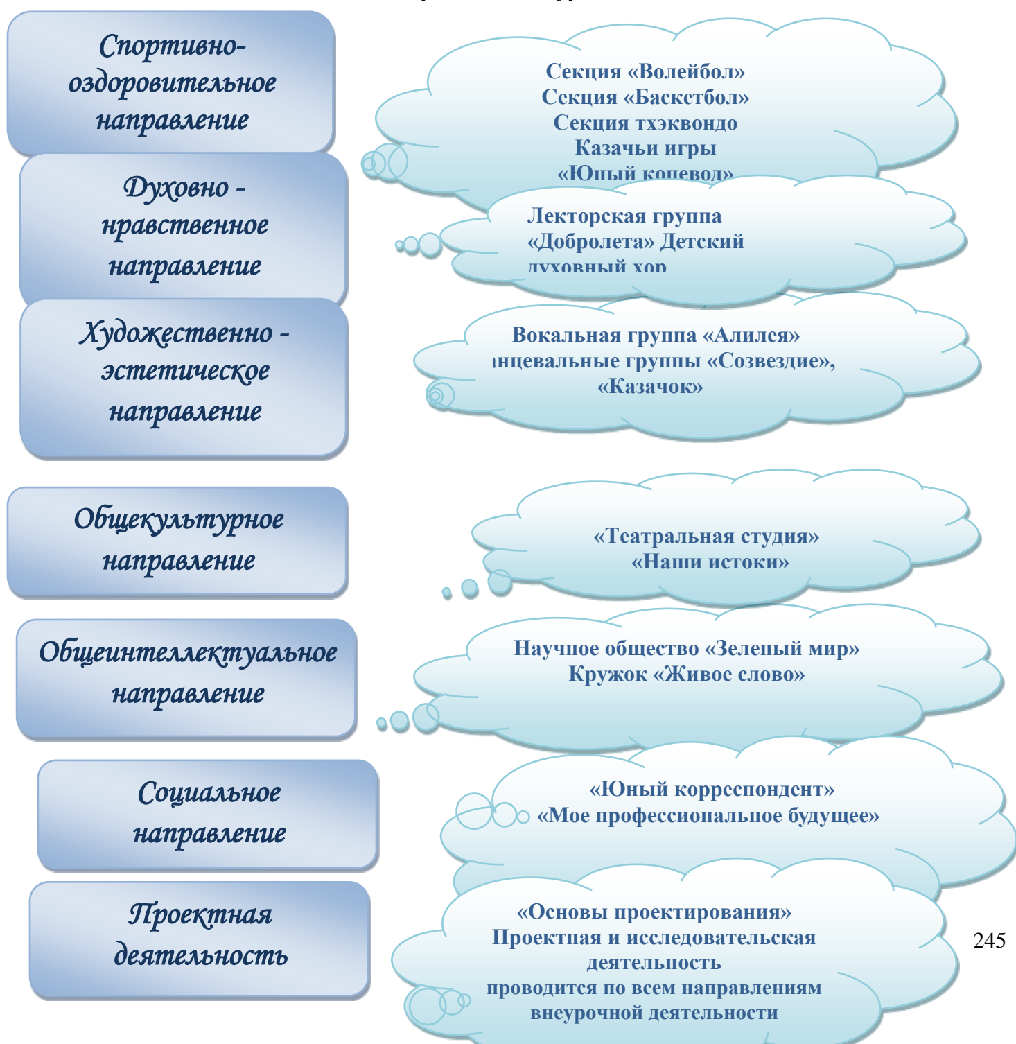
Схема направлений внеурочной деятельности

3.1.2. План внеурочной деятельности (Приложение)