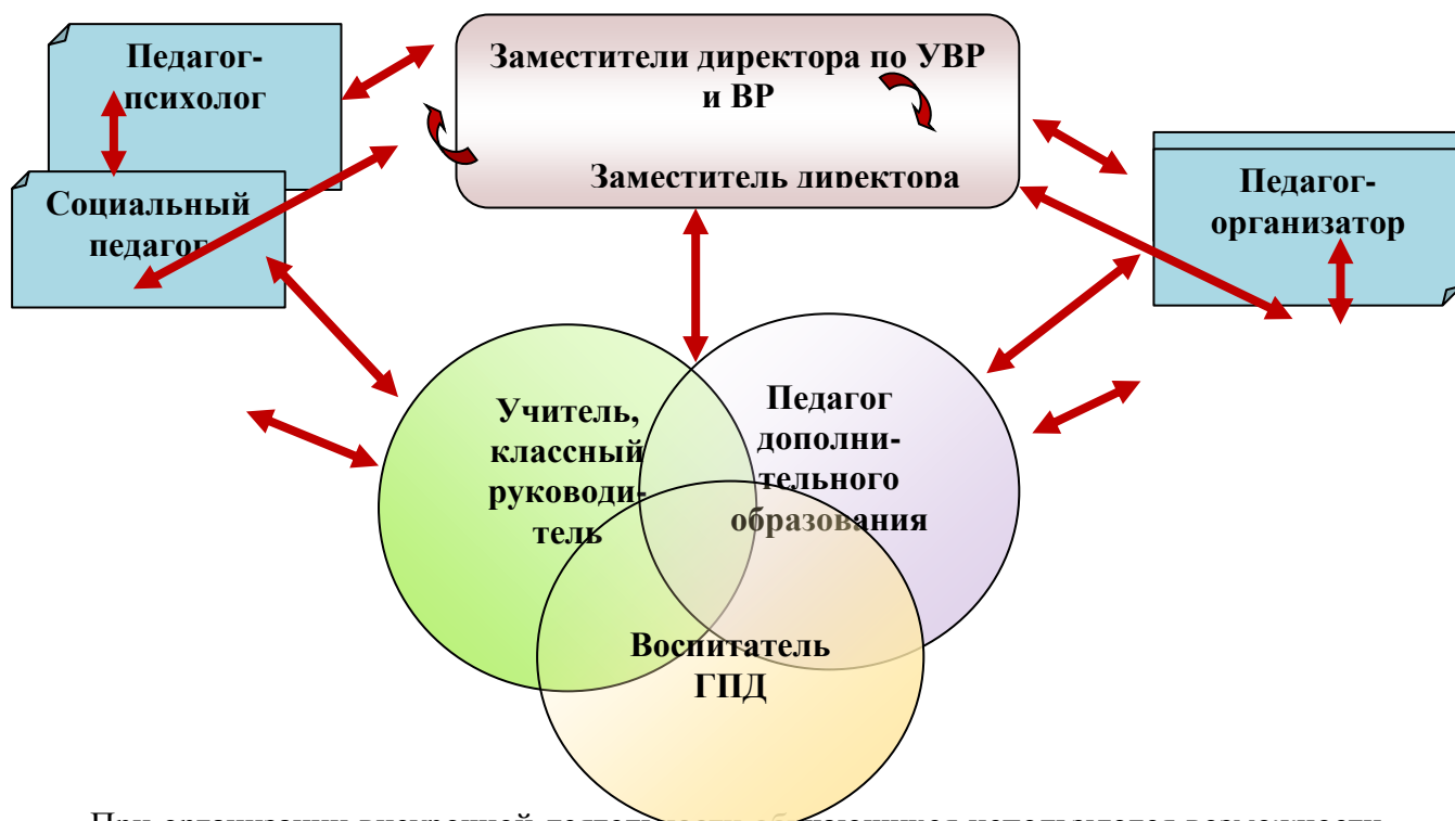
Модель взаимодействия педагогов

При организации внеурочной деятельности обучающихся используются возможности образовательных учреждений дополнительного образования детей, учреждений здравоохранения, культуры и спорта, участие общественных и религиозных организаций.